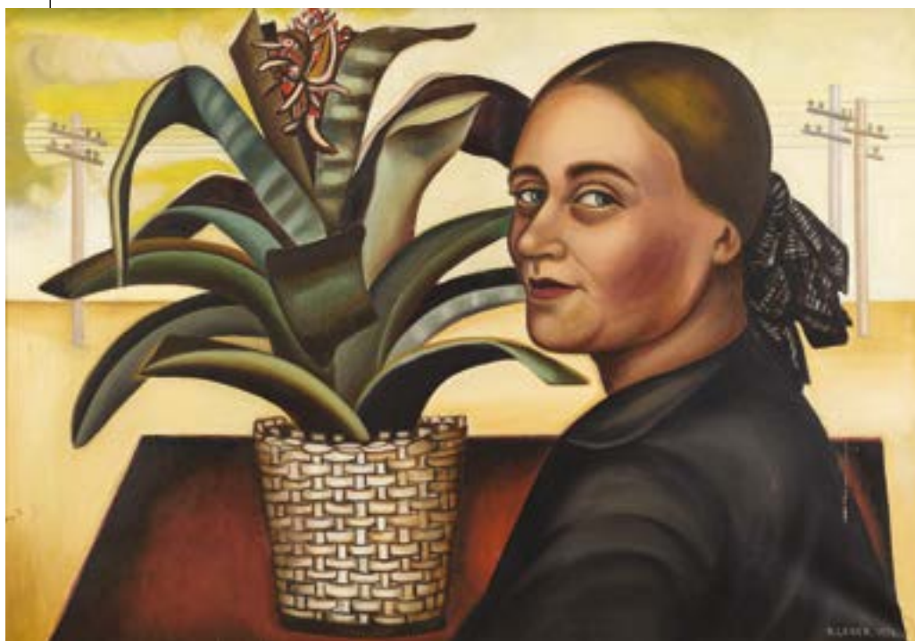
Nadia Léger Autoportrait à la plante 1956 Huile sur toile Collection particulière

Cette rétrospective suit la longue et riche carrière de Nadia Léger à travers les lieux de son parcours initiatique, de la Russie à la France, où s'est déployé un talent parvenu à maturité. L'exposition explore les avant-gardes au sein desquelles elle a évolué, confronte son œuvre à celle de ses contemporains - en particulier celle de Fernand Léger et des élèves de l'Atelier - et établit des correspondances entre son art et ses engagements politiques et sociaux. Nadia Léger. Une femme d'avant-garde entend ainsi lui assurer la place qu'elle mérite dans l'histoire de l'art moderne, en ancrant son œuvre dans l'histoire politique, culturelle et de « mentalités » de son temps.