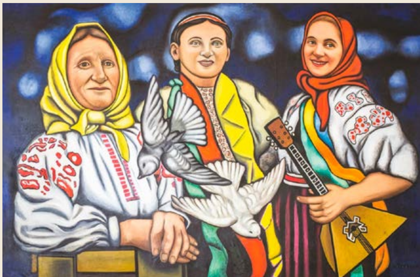
Grand Palais/Rim (musée Fernand Léger) - © François Fernandez/SABAM Belgium 2024